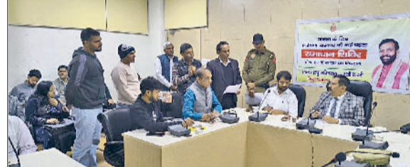
भिवानी। जिला के अधिकारी स्वयं शिविर में मौजूद रहें।

कि प्रशासन को किसी भी माध्यम से प्राप्त होने वाली जनता की प्रत्येक शिकायत का समाधान प्राथमिकता से हो। शिकायतों के समाधान में ढिलाई किसी भी हाल में सहन नहीं होगी। जिला अधिकारी स्वयं समाधान शिविर में मौजूद रहें और अपने विभाग की शिकायतों को