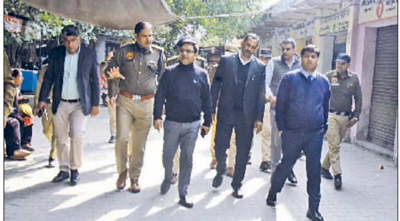
भिवानी। सचिवालय परिसर का निरीक्षण करते सेशन जज, उपायुक्त व एसएसपी।

परिसर की चारदिवारी को ऊंचा उठाने और अनाधिकृत या गैर जरूरी प्रवेश और निकास द्वारों को बंद करने के निर्देश हरिभूमि न्यूज ▶▶ मिवाणी