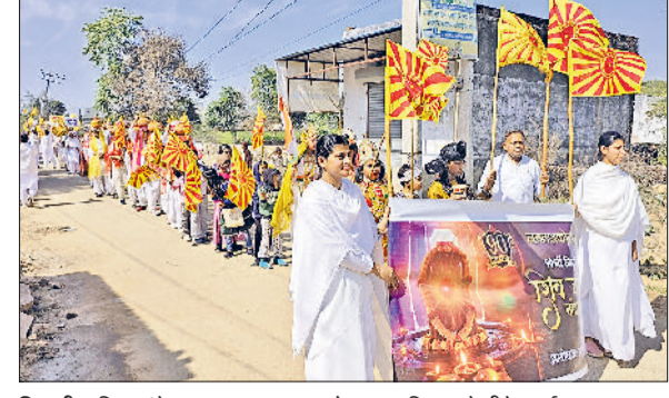
भिवानी। शिव संदेश सद्भावना कलाशोभायात्रा निकालते वीके भाई बहन।