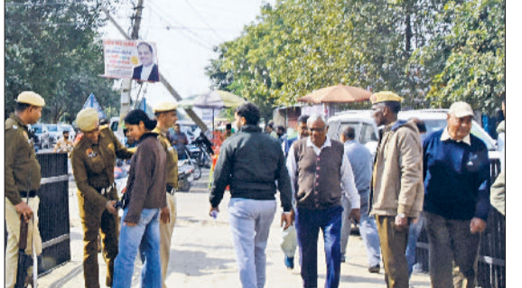
सचिवालय परिसर के बाहरी गेट पर अंदर जाने वाले की जांच करती पुलिस।