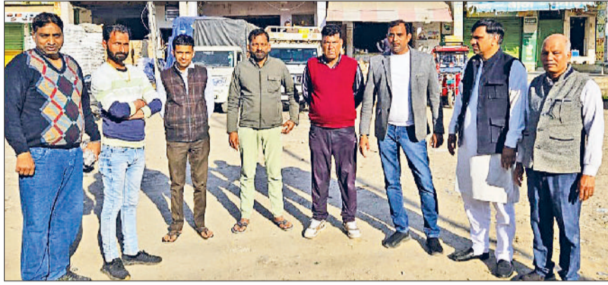
मिवाणी। वह जगह जहां पर पार्किंग बनवाई जानी है, उसी को दिखाते कुछ लोग।