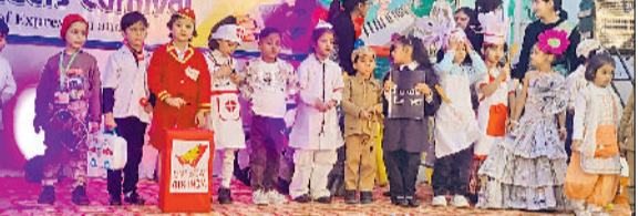
भिवानी। फैंसी ड्रेस प्रतियोगिता में भाग लेते विद्यार्थी।